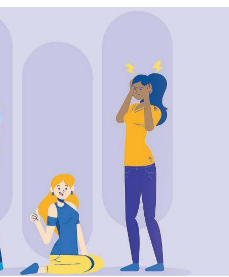
Diecimila. I bresciani che non studiano e non lavorano